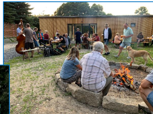
Ilustrační foto jsou z loňského roku

O přesném programu na plánovaných akcích Vás budeme včas informovat na letáčích a webu obce.