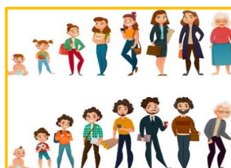
Počet obyvatel v obci k 31. 12. 2023