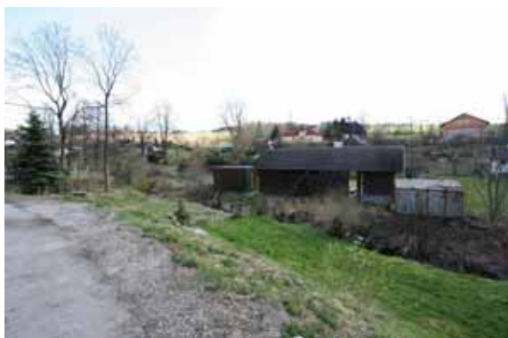
stávající sportovní plocha se zázemím