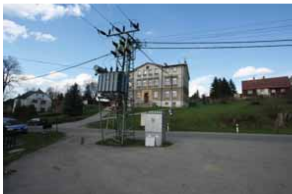
trafostanice u parkovací plochy

V místě u hlavní komunikace je nyní neupravená parkovací plocha a velmi svažité zatravněná plocha. V místě vodního toku je neudržovaná zeleň a provizorní lávka. Současné zázemí sportovní plochy bylo postaveno bez příslušných povolení a nesplňuje bezpečnostní a hygienické zásady (nefunkční odkanalizování WC). Samotná sportovní plocha je částečně zatravněná a částečně pokryta umělohmotnými koberci.