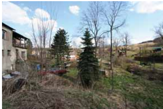
neudržované zelené plochy