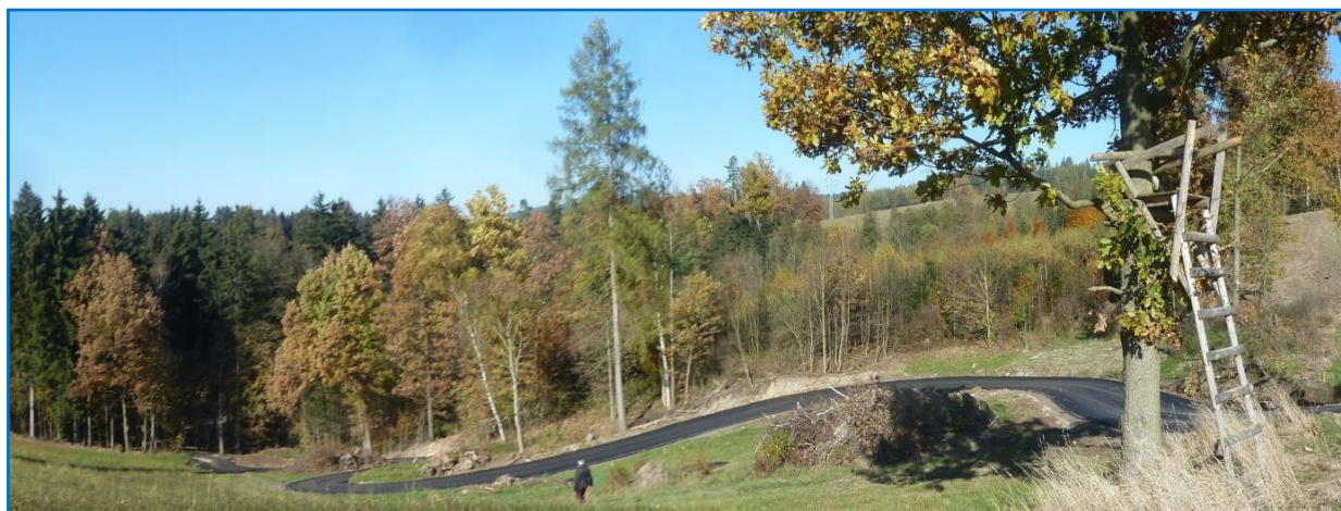
nová polní cesta z Dalešic do Pulečného